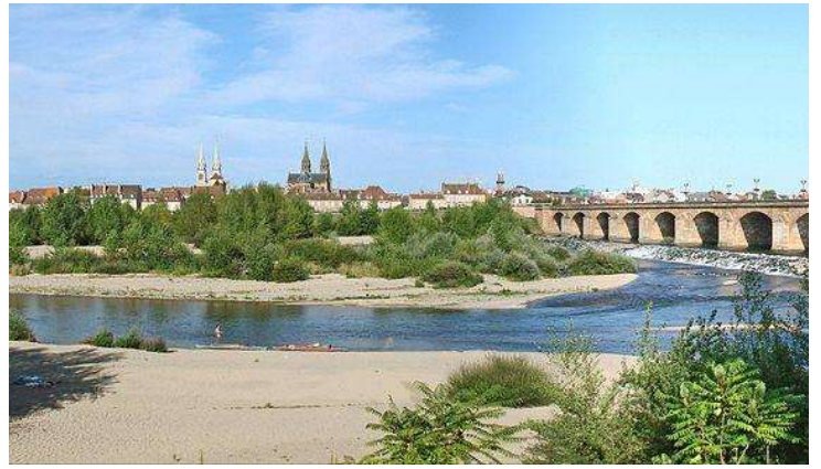
Pont Régemortes à Moulins