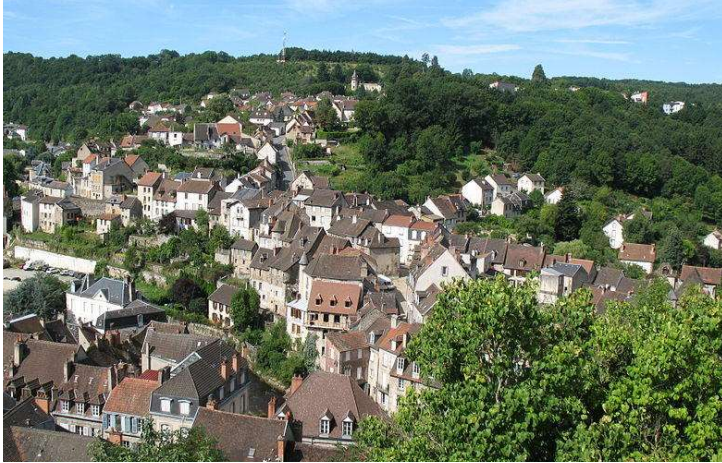
Vue panoramique sur la ville d'Aubusson

élébrée et appréciée par de nombreux peintres impressionnistes, la Creuse déborde d'activités et de manifestations en tout genre. Paisible et naturelle, elle offre à ses visiteurs la possibilité de se ressourcer en explorant ses brocantes et vide-greniers. Tour d'horizon des événements qui auront ravir les passionnés.