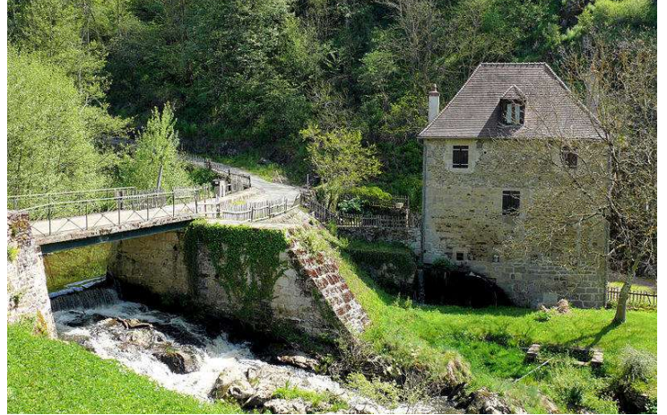
Le moulin de la ville de Boussac