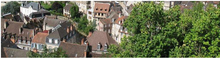
Vue panoramique sur la ville d'Aubusson