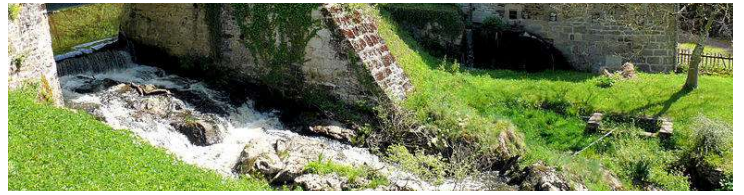
Le moulin de la ville de Boussac